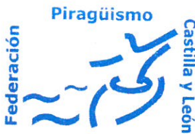
Fdo.: Constantino Javier Domínguez Sabadell