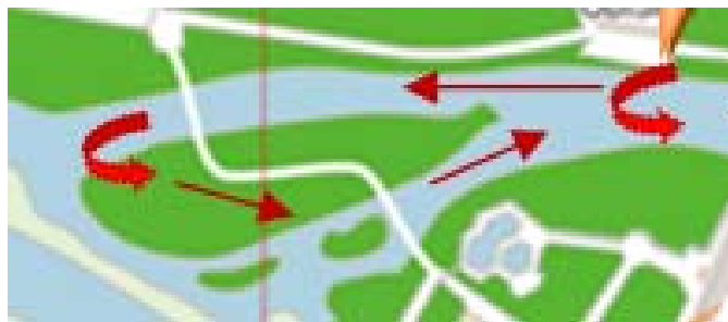
Zona del porteo y última ciaboga.